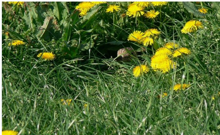
Zoekplaatje: wulp op het nest

Via nieuwsbrieven willen we u op de hoogte houden van de activiteiten van de Vereniging Weidevogelbescherming Staphorsterveld e.o. Op onze website www.wvbstaphorsterveld.com kunt u meer informatie over ons vinden.